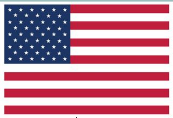
Ambassade des États-Unis d'Amérique au Cameroun